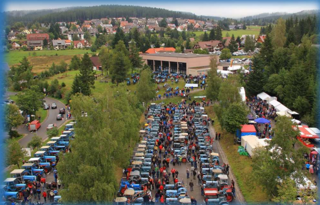
Das internationale Eicher-Treffen in Schluchsee